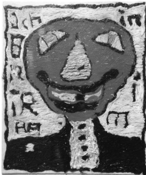
Anno Haude, Kunst-Praxis Soest e.V.

■ Zuversicht und Vertrauen in die in einem jeden Menschen innewohnenden Gesundheitskräfte aufrechterhalten, selbst in schwierigsten oder scheinbar unveränderlichen Situationen;